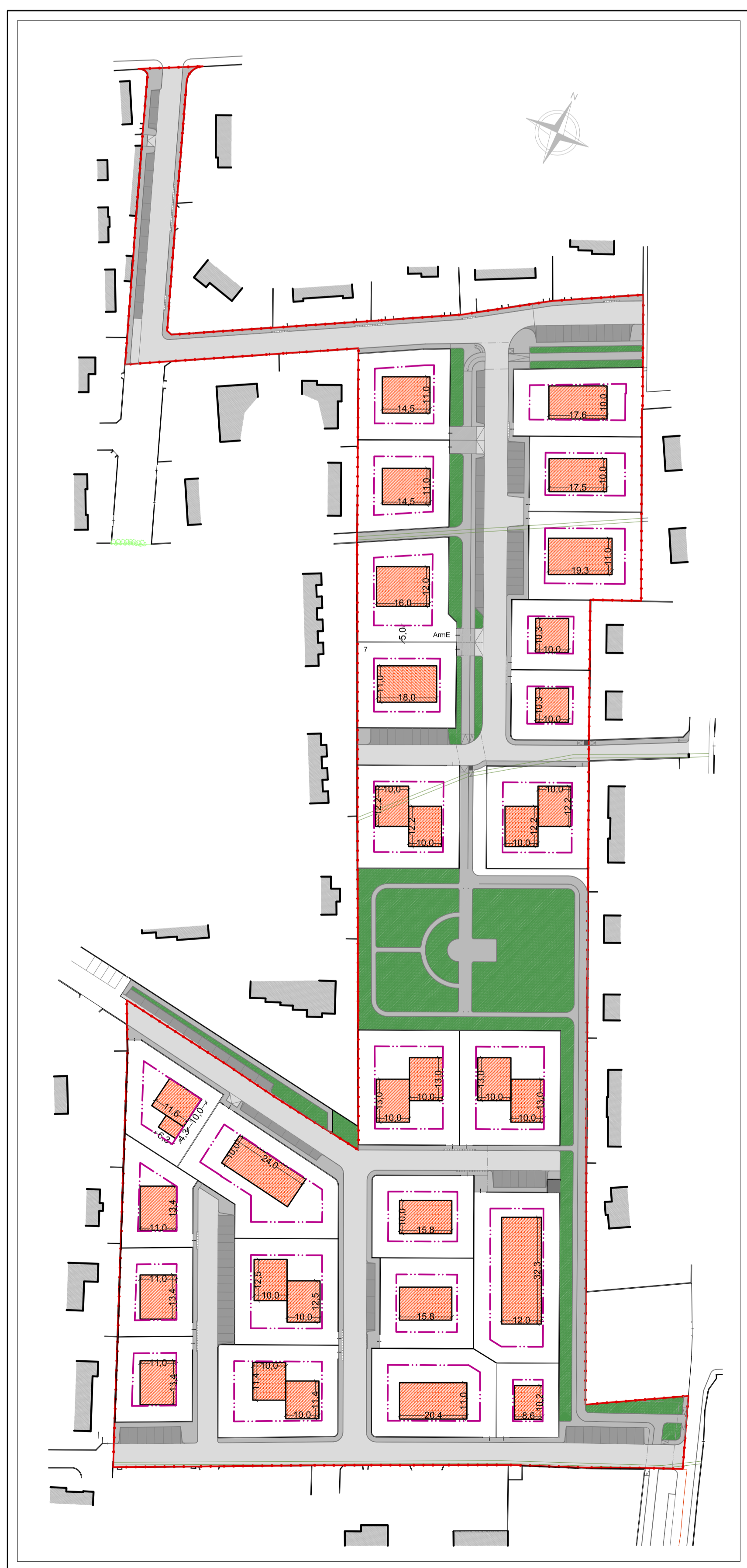
PLANIMETRIA GENERALE - scala 1:1000 - Previsioni indicative degli edifici realizzabili