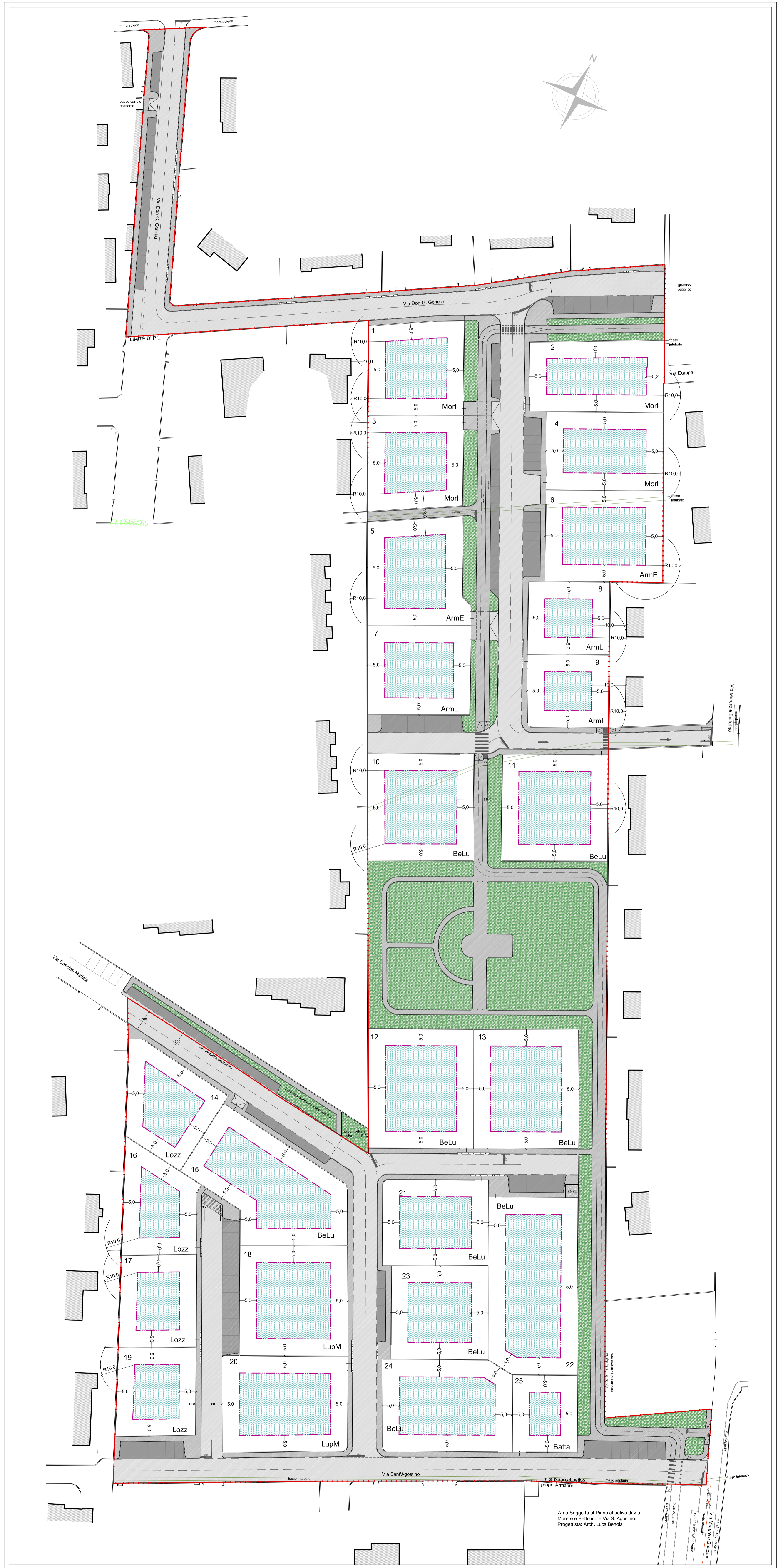
PLANIMETRIA GENERALE - scala 1:500