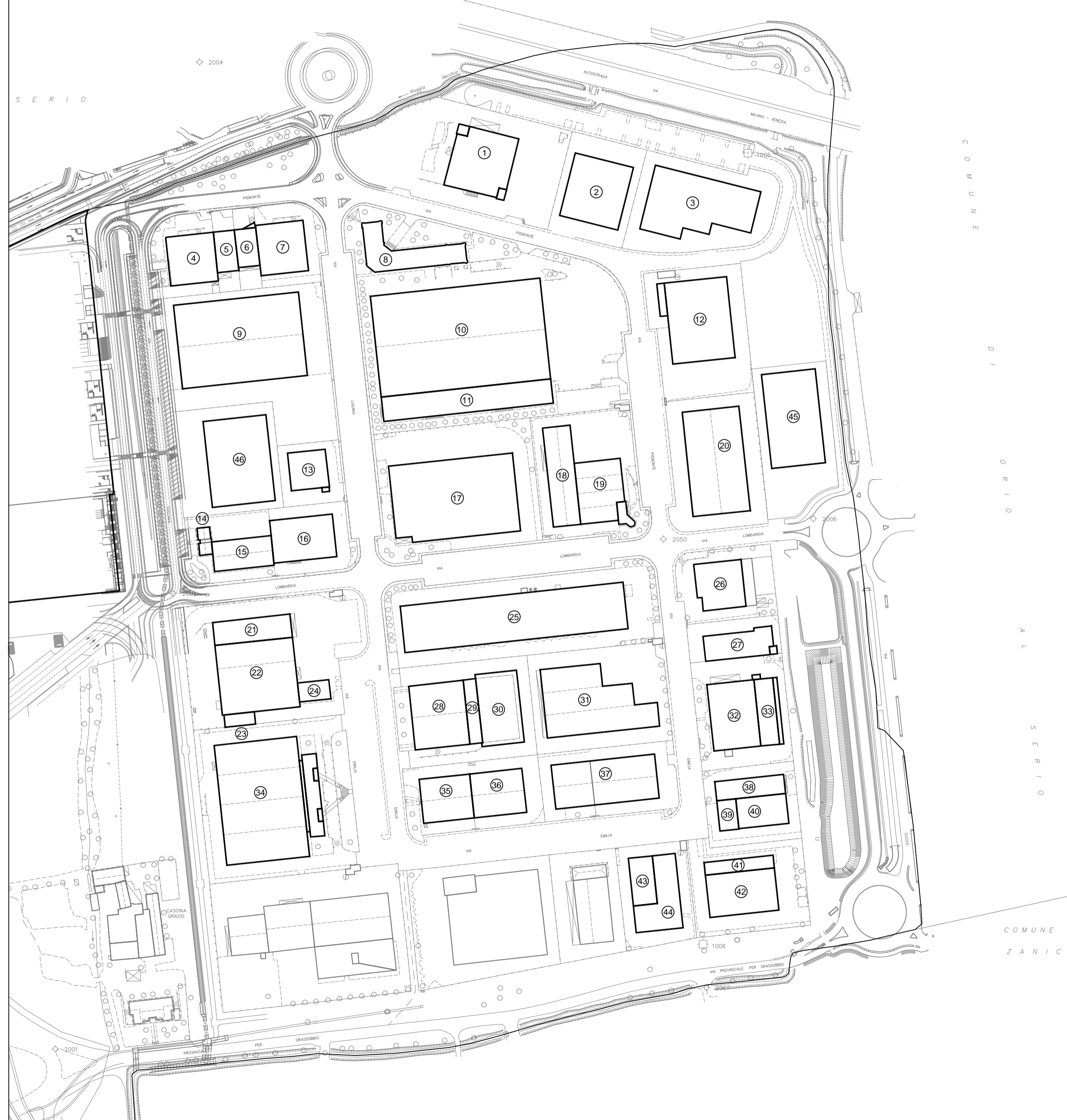
TABELLA RIASSUNTIVA DELL'EDIFICATO ESISTENTE COMPARTO D2

via Don Carlo Botta 9 - 24122 Bergamo tel fax 035.270074 - r2studio@virgilio.it