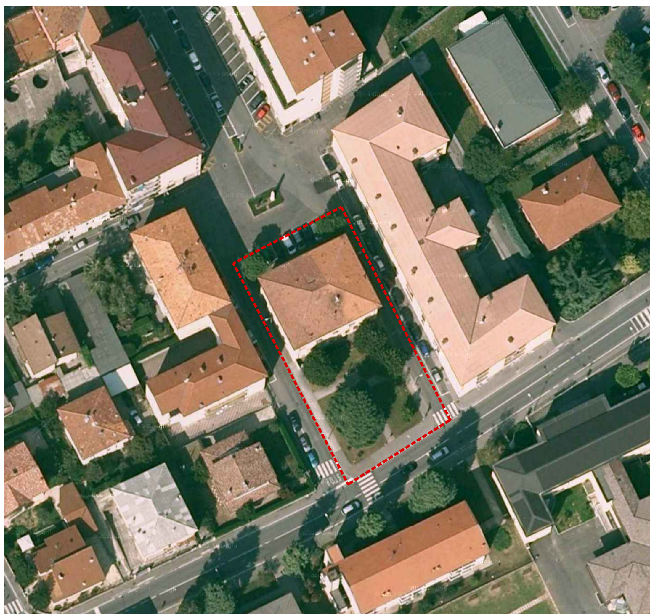
ORTOFOTO SC. 1/500